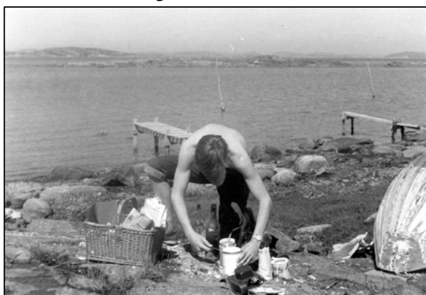
Vårarbete 1956. Bilden tagen vid nerfarten strax ovanför den nuvarande bryggan som ägs av Jörlanda Bryggförening.

Under 60-talet byggdes Jörlanda ut och många villor tillkom. Fler personer blev nu intresserade av att ha båt och därmed en fast tilläggningsplats. 1967 förlängdes bryggan så att den kom att rymma ett 10-tal båtar. Men så kom den ödesdigra stormen och en vecka senare orkanen i september 1969. Bryggan spolades bort liksom alla båtar utom en. Ägarna fick bege sig på vandring ända ner till Kyrkeby för att hitta båtar och bryggdelar innan man kunde återuppbygga den ursprungliga bryggan.