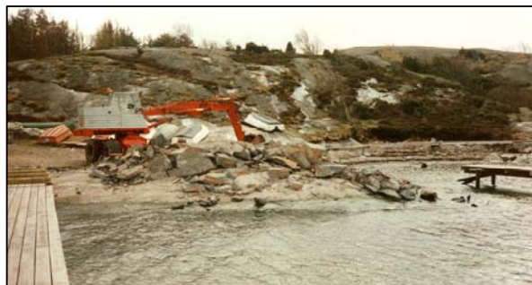
Bild från sprängningen av bergsklacken 1989.