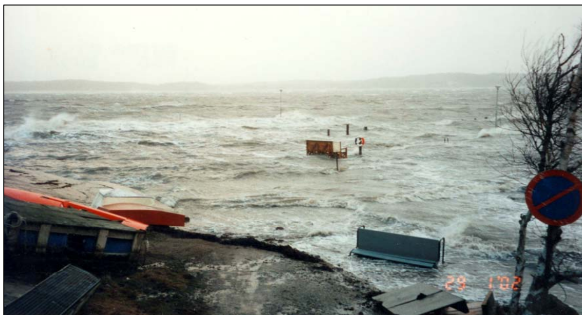
Stormen 29 januari 2002

Hamnen är utsatt för framför allt västliga vindar. Stenbryggan utgjorde en bra vågbrytare för delar av hamnen men för att skydda resten av hamnen behövdes en längre vågbrytare. Bengt Gunnarsson tog därför under slutet av 80-talet fram offerter på olika alternativ för bättre vågskydd men inga beslut togs vid denna tid. Under slutet av 90-talet utredde återigen Bengt och Martin Gunnarsson möjligheterna att få tillstånd att anlägga ett bättre vågskydd. 2001 beviljade Länsstyrelsen tillstånd att förlänga stenbryggan med två vågdämpande pontonbryggor om vardera 20 meter. Bryggorna beställdes av Martin och våren 2002 var dessa på plats. Martin Gunnarsson är den som ansvarar för dessa bryggor. Pontonbryggorna medförde ett klart bättre vågskydd för båtarna i hamnen och innebar också möjlighet för 11 nya platser för större båtar. Bryggorna har också blivit populära för såväl badande som sportfiskare.