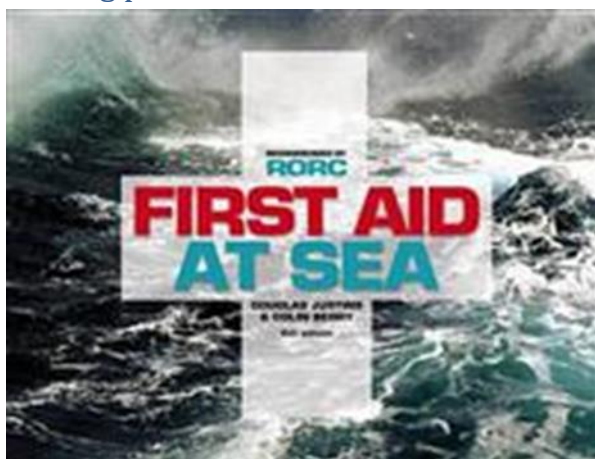
First aid at sea ISBN 9781408157039