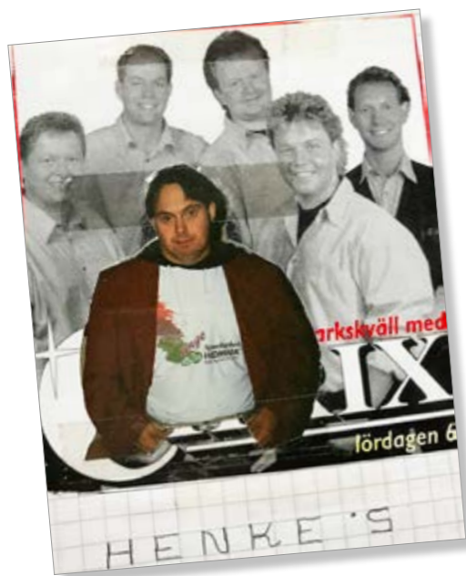
Ett inslag i en av Henriks romaner. Han har klippt in sig själv som frontfigur i bandets affisch.

fotografier innan de var sönderklippta. I hans egna fotoalbum fattas det ansikten på många personer.