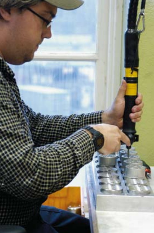
Åre Produktion har investerat i en egen monteringsavdelning. Där sätter man ihop detaljer till färdiga system, provar och levererar färdiga komponenter till kund.