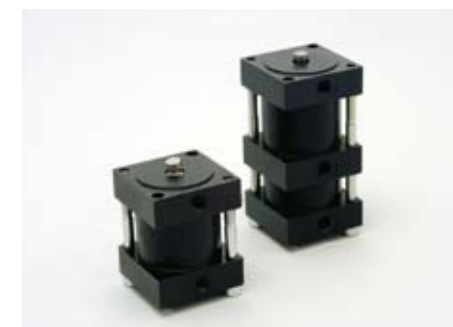
Produkt: Bearbetad, monterad och provad luftcylinder.