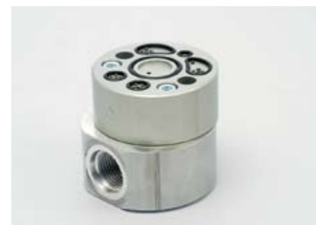
Produkt: Bearbetad, monterad och provad hydraulisk el-ventil.