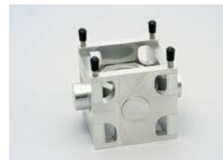
Produkt: Fäste för hydraulcylinder.