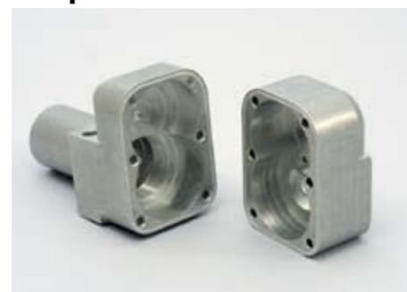
Produkt: Växelhus till en skoterveriator.