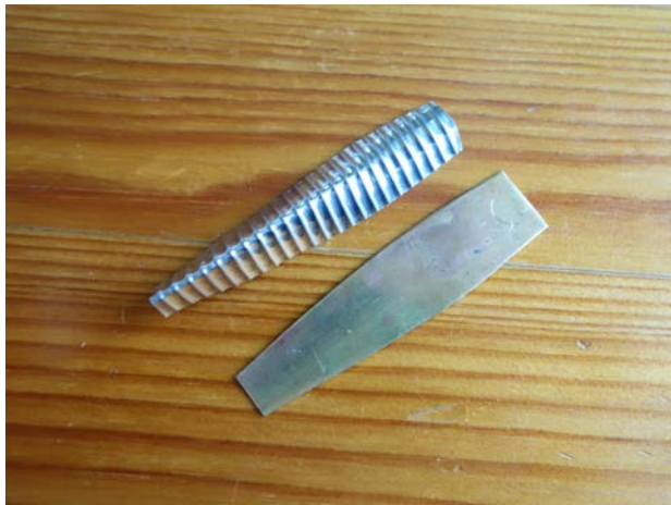
Tillklippta ämnen före lödningen.