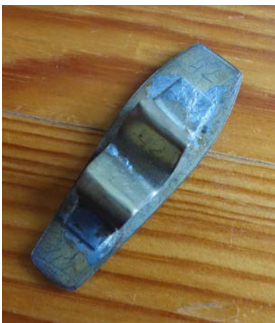
Klippmall för plåten till en 42:a.