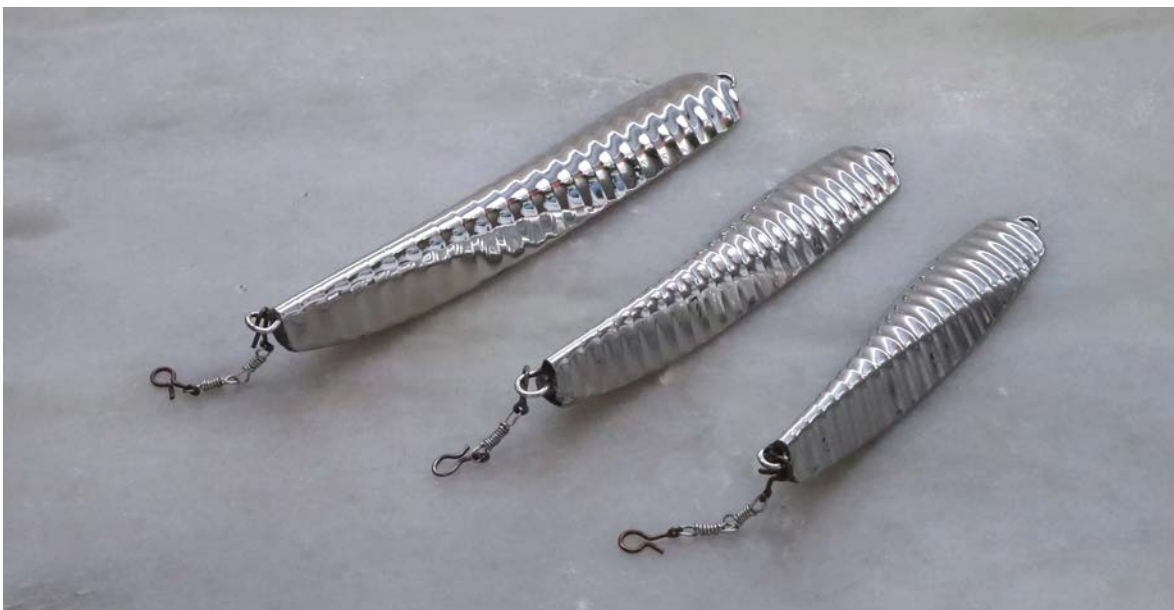
Handgjorda pirkar för den kräsne tävlingsfiskaren.