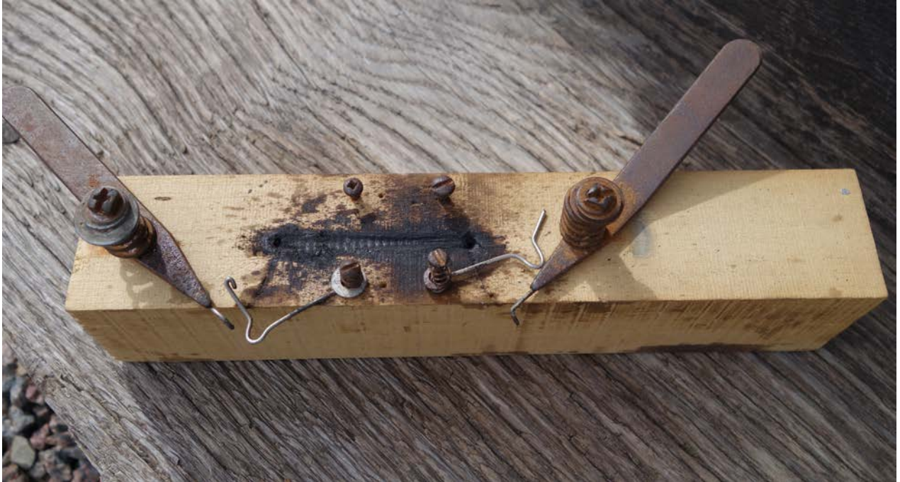
En väl använd jigg för lödning. Fungerar alldeles utmärkt enligt upphovsmannen.

Han gör idag 3 olika längder 42 mm (väger c:a 7 gram), 45 mm (c:a 9 gram) samt 50 mm (cirka 12 gram). Någon bamse på 30 gram har det också blivit och en serie på 35 mm, men inte nu längre.