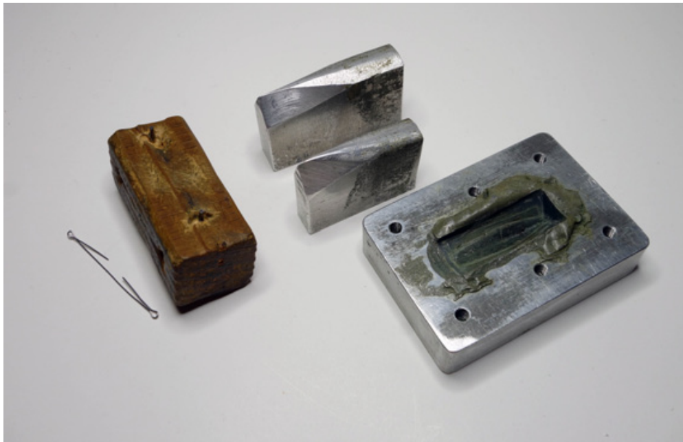
Pipa slog plåtarna för hand i egengjorda formar. I mitten står två förböckningsmallar.