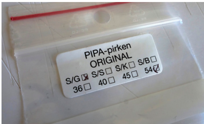
Rätt etikett för en äkta Pipa-pirk.

Tyvärr har Pipas pirk blivit kopierad de senaste åren av mindre nogräknade leverantörer som erbjuder Pipa-pirken till ett "mycket facilt pris". De finns fortfarande i handeln men man har numera ändrat pirkarnas namn till "typ Pipa", "Pipa Super", NM Classic Pipa. Kopiorna är masstillverkade i öststaterna och saknar helt originalets hantverksmässiga kvalitet och känsla.