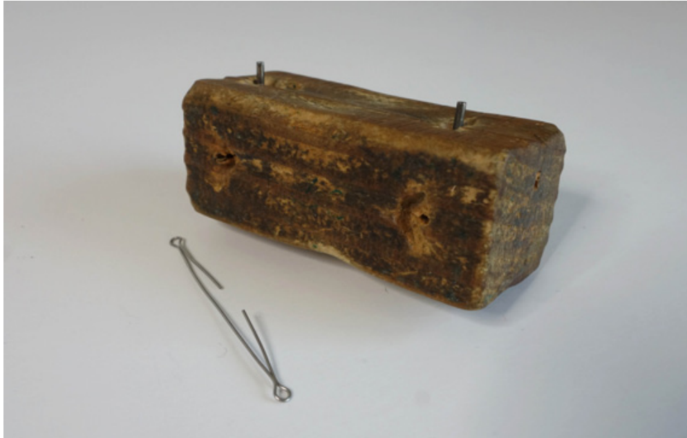
Väl använd fixtur till Pipa-pirkens trådöglor.