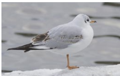
Skratmås i vinterskrud.