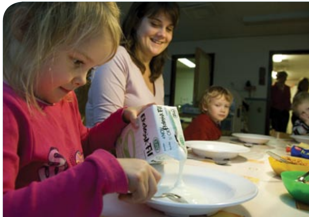
Förskolan Karlavagnen fick utmärkelsen Årets verksamhet som delades ut för första gången i år.