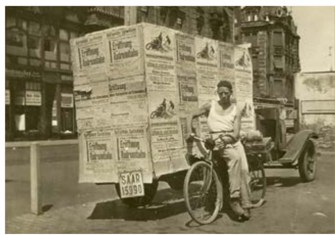
7 Saarbrücken 1935