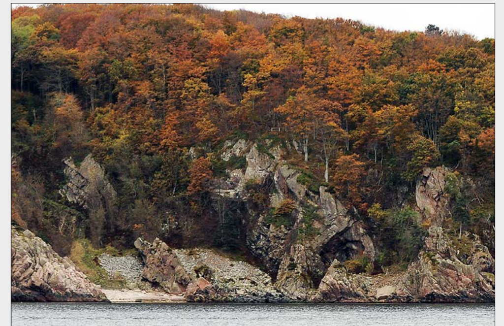
Text Lars Pålsson Foto 1962 Hans-Otto Pyk Foto 2012 Lars Göte Nilsson

Utställningen finns på naturum Kullaberg och pågår under tiden den 1 juni–31 oktober