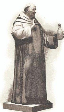
Dom Pierre Pérignon , moine bénédictin 1638-1715