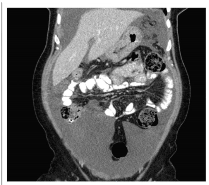
Bild 1. CT-buk på patient med pseudomyxoma peritonei.