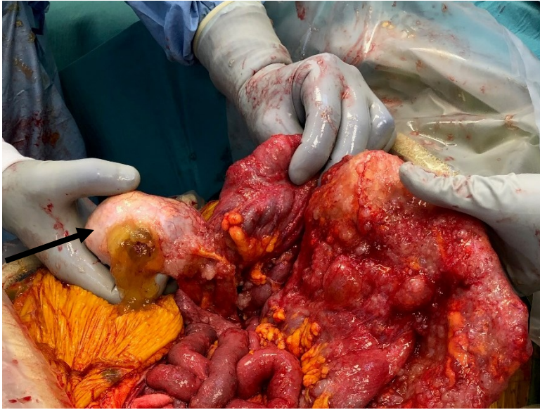
Bild 2. Patient med rupturerad LAMN i appendix (svart pil) med avancerad pseudomyxoma peritoni utbredning.