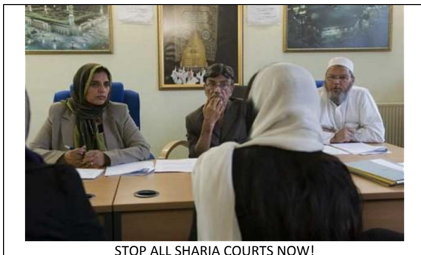
STOP ALL SHARIA COURTS NOW!