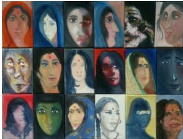
Nearly 3000 cases of 'honour' violence every year in the UK