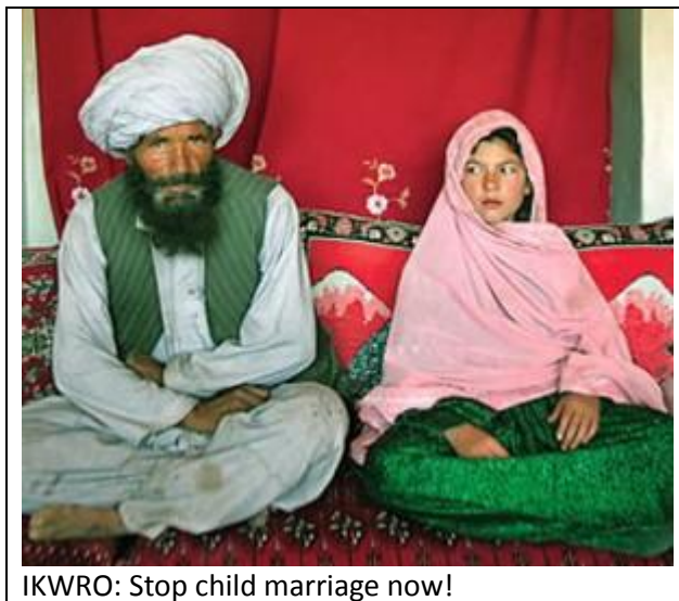
IKWRO: Stop child marriage now!

grupper vara utsatta för risk för tvångsäktenskap eller hedersmord. Hur hjälper ni dem då? Deras svar var: ”Vi erbjuder en axel att gråta mot”. Vi blev naturligtvis helt förbluffade inför ett sådant svar. Dessa flickor behöver inte i första hand någon axel att gråta mot. De behöver råd och deras säkerhet måste säkras först. Men vad gör ni, bara låter dem gråta och sedan gå hem igen, framhöll vi. Då kommer hon att bli tvångsgift och våldtagen, torterad och kanske mördad för familjens skull. Detta är inte acceptabelt. Men trots detta trodde de inte på att det fanns risker för tvångsäktenskap. Och vi insisterade, att det är ju välkänt att sådant sker och det måste ni också veta. Det är en del av ert ansvar att skydda barn och sårbara kvinnor. Ni kan inte bara ignorera detta!