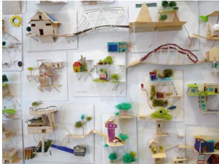
På Arkkis utställningslokal i Helsingfors visas resultatet av workshops med barn om arkitektur.