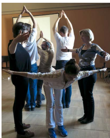
Bild från vår workshop, då deltagarna föreställer Kölnerdomen