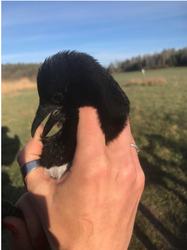
En av årets två ringmärkta skator.

Efter en mild, regnig och blåsig vinter kom en period med varmt och torrt väder in över landet i april med flera värmerekord i Norrland. Inledningen på märksäsongen i maj var istället sval och ostadig. Juni och juli var tämligen ordinära medan augusti efter en ostadig inledning gav värmebölja under den senare delen av månaden.