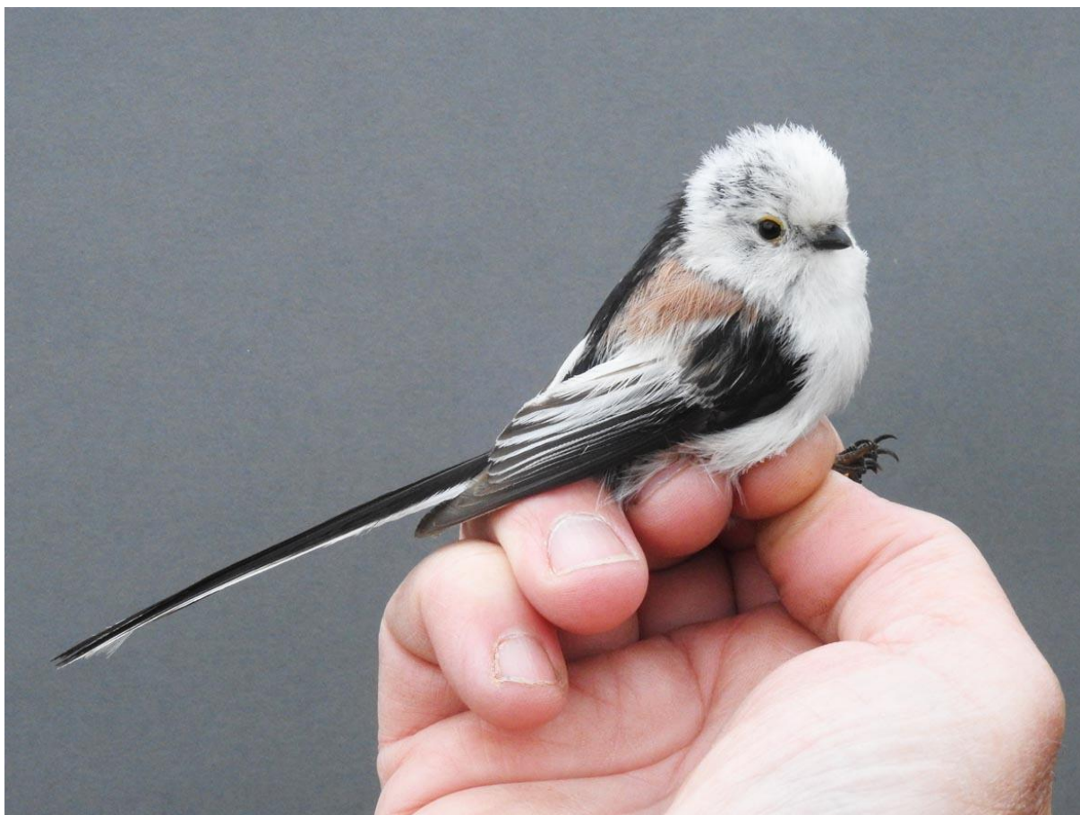
Stjärtnes – en av de arter som ökat i märkningen under senare år.