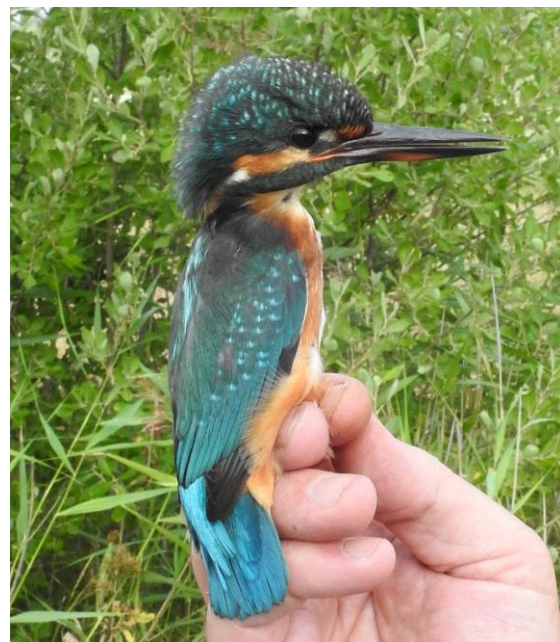
Nya märkarter 2018 – gök och kungsfiskare.