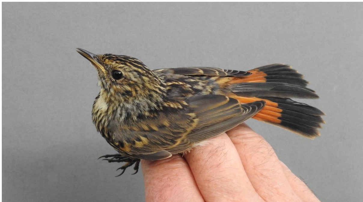
Blåhake fångad 29 juli.

Spännande var den unga blåhake som fångades redan den 29 juli. Denna fångst är tidigare än vad Lindänget utanför Orsa någonsin fångat en ungfågel på hösten. Under senare år har den sydliga rasen vitstjärnig blåhake börjat expandera norrut och 2018 sjöng flera hanar i landet. Ungfåglar går tyvärr inte att rasbestämma utifrån utseende.