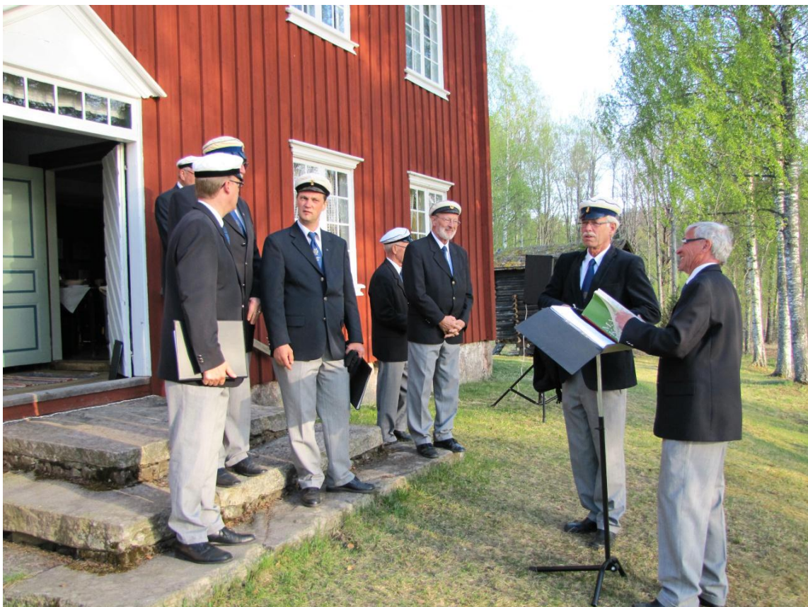
IRIS-kören börjar samlas vid Storbondgården