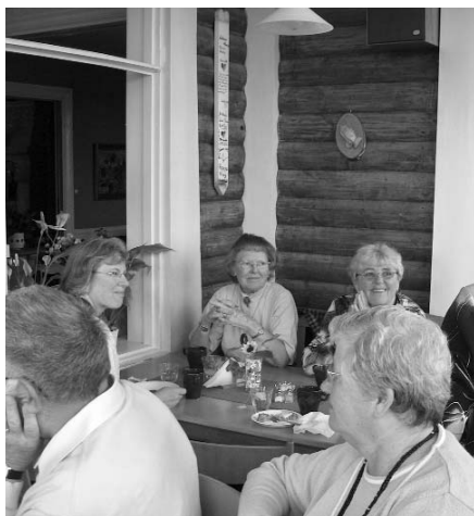
Vännerna från Norge vid fikapausen.

gon medmänniskas problem och behov varje dag, så att vår medkänsla väcks. Men vi ska inte trötta ut oss på många! Hon framhöll för övrigt att själsliga sår kan skapa ett levnadsmönster, som fördröjer den fullständiga läkningen efter ett Gudsingripande som svar på bön.