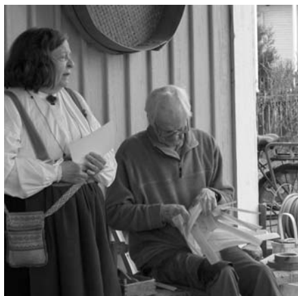
Demonstration av korgflätning.

ken läkande process och frid som utvecklas hos oss själva när vi på så sätt anpassar vår vilja till Guds.