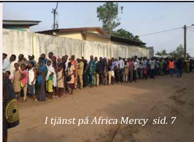
I tjänst på Africa Mercy sid. 7