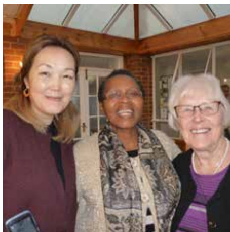
Representanter från Ryssland, England och Sverige

De närmare 30 deltagarna kom från olika håll i Europa. Tisdagen var avskild som bön- och fastedag, med möjlighet att gå ut i de vackra omgivningarna eller vara i stillhet. Fastan bröts med middag på kvällen.