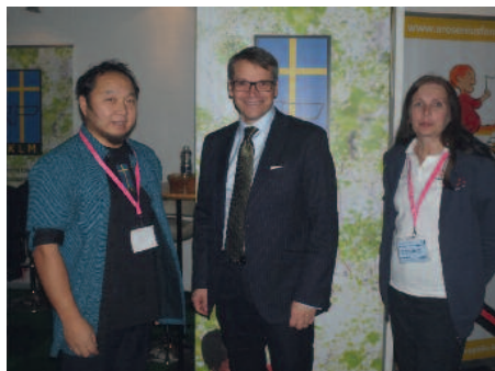
Socialminister Göran Hägglund på besök i SKSF:s och KLM:s monter på medicinska riksstämman.

till vårdpersonal, men träffade även några politiker. På onsdagskvällen hade vi en liten SKSF-träff på Elisabetgården, och på torsdagskvällen inbjöd KLM till Elimkyrkan för samtal om samvetsfrihet.