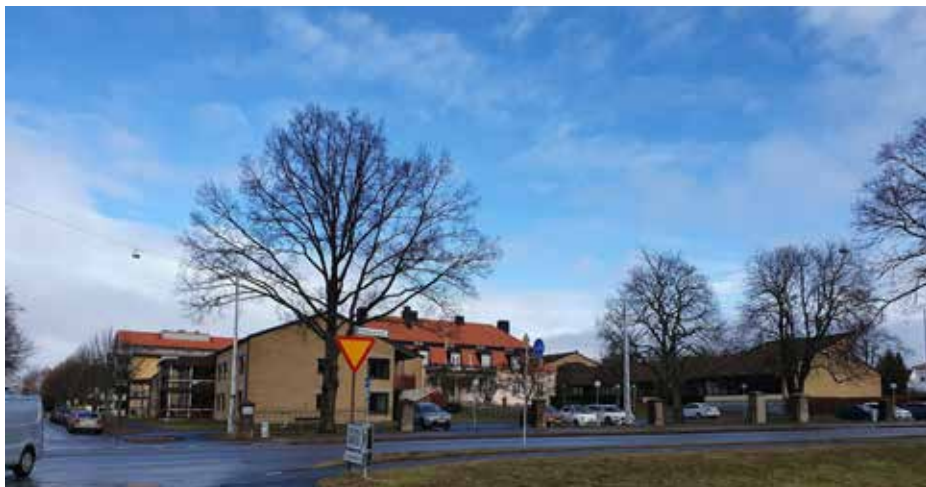
Lindgårdens äldreboende har drivits på kristen grund i många år men ska nu avvecklas

ma atmosfär som funnits där. Personal har uttryckt att det har varit en plats där man både fått växa och läka. Andra har sagt att Lindgården har varit som deras andra hem.