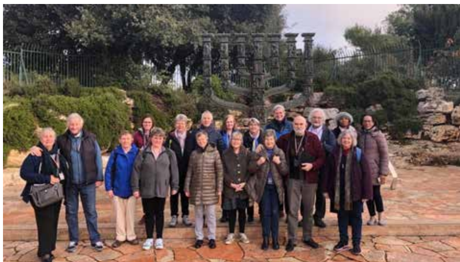
Gruppen som gjorde turen tillsammans efter böneveckan står här framför den stora Menorah som är placerad mittemot Knesset. Vi stannade där en stund och bad för Knesset.