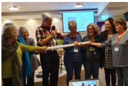
Israel lämnar över till Schweiz