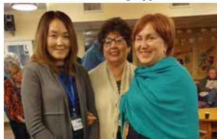
Tre vänner från Ryssland