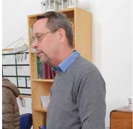
Journalisten som startade Shevet Ashem

När han läste sin Bibel och speciellt profeterna såg han att det är vad Gud gör med sitt folk idag. Han ville komma och se Israel. Då han reste runt i Israel såg han ingestans där han kunde gå in i en uppgift. Han sa till Gud: Jag ser inte vad jag kan göra här. Han upplevde hur Gud kallade honom. Han hade ingen som stod bakom honom och hade heller inga egna tillgångar, men upplevde hur Gud talade till honom och lovade leda. Sovjetunionen öppnades och många kristna hjälpte då judar att komma till Israel. Han tänkte att han kunde hjälpa till. En dag fick han kontakt med en ickejudisk pojke. Hans mor berättade att pojken