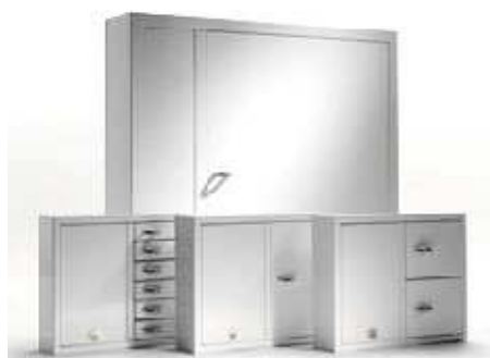
Key Box utbyggnadsskåp