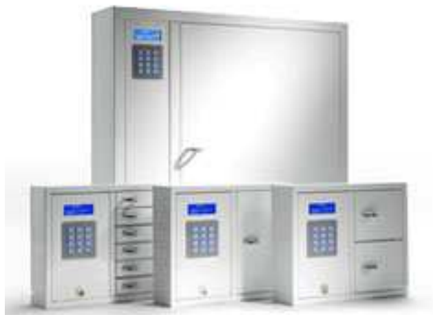
Key Box huvudskåp