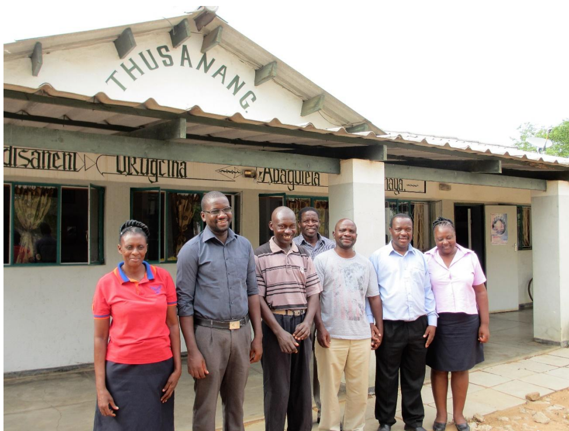
Personalen på Thusanang februari 2016