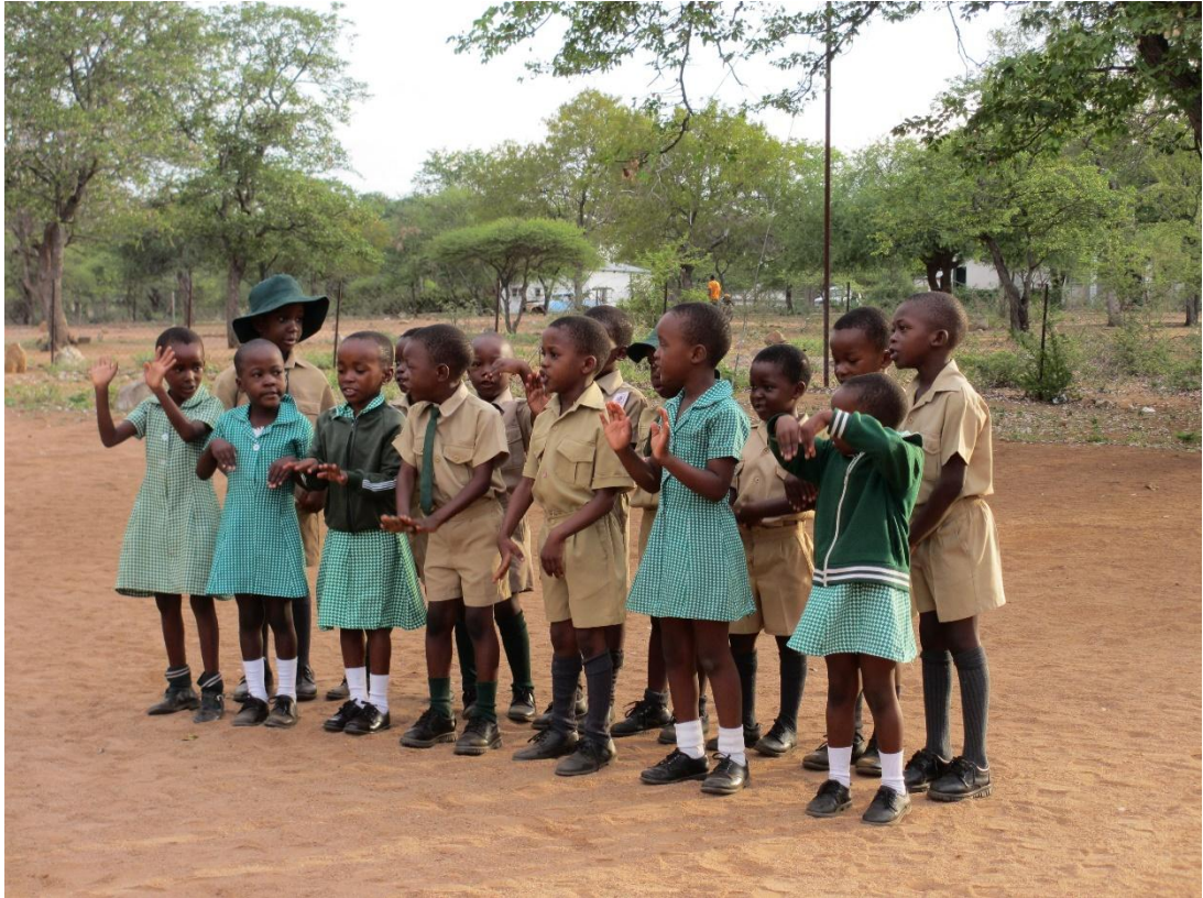
Manama Primary School, första klassen sjunger en rörelsesång