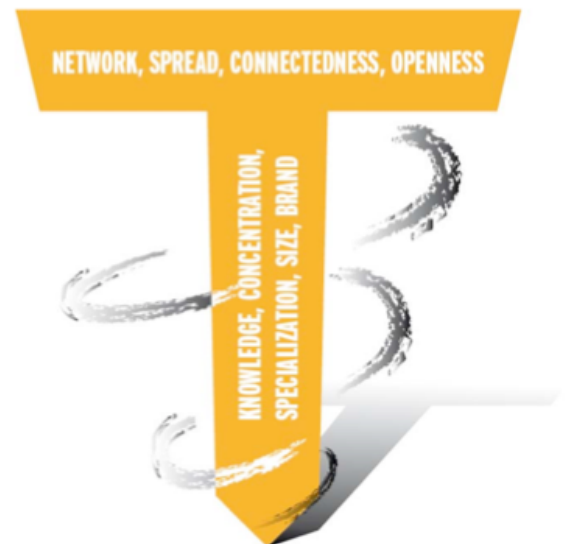
De tre T-krafterna formar tillsammans ett T

På engelska skulle man kunna säga att det handlar om: Thinking, Linking and Blinking.