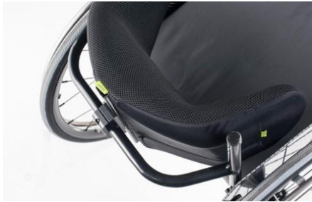
Modell Segment-djup, med enkelt fäste i rullstolens horisontella stag.