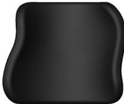
Modell Standard med fästbeslag Original mellan rullstolens ryggrör samt Standard rygg med asymmetrisk justering.