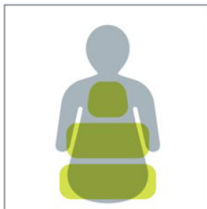
Enkelt å tilpasse ulike kroppsfasonger