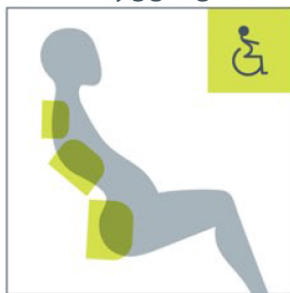
Enkelt å tilpasse til ryggøylen