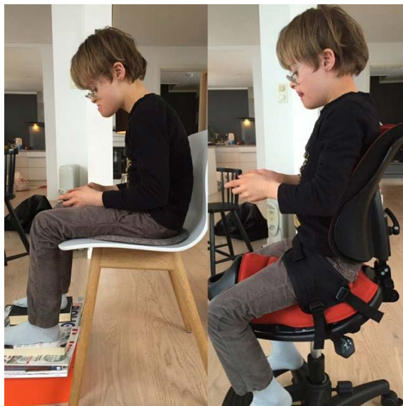
Krabat sadelstol finns med arbetsstolsunderrede - Krabat Jockey Lite

Med en rak och symmetrisk bål kommer skuldran i det läge där armar och händer är lättast att kontrollera.