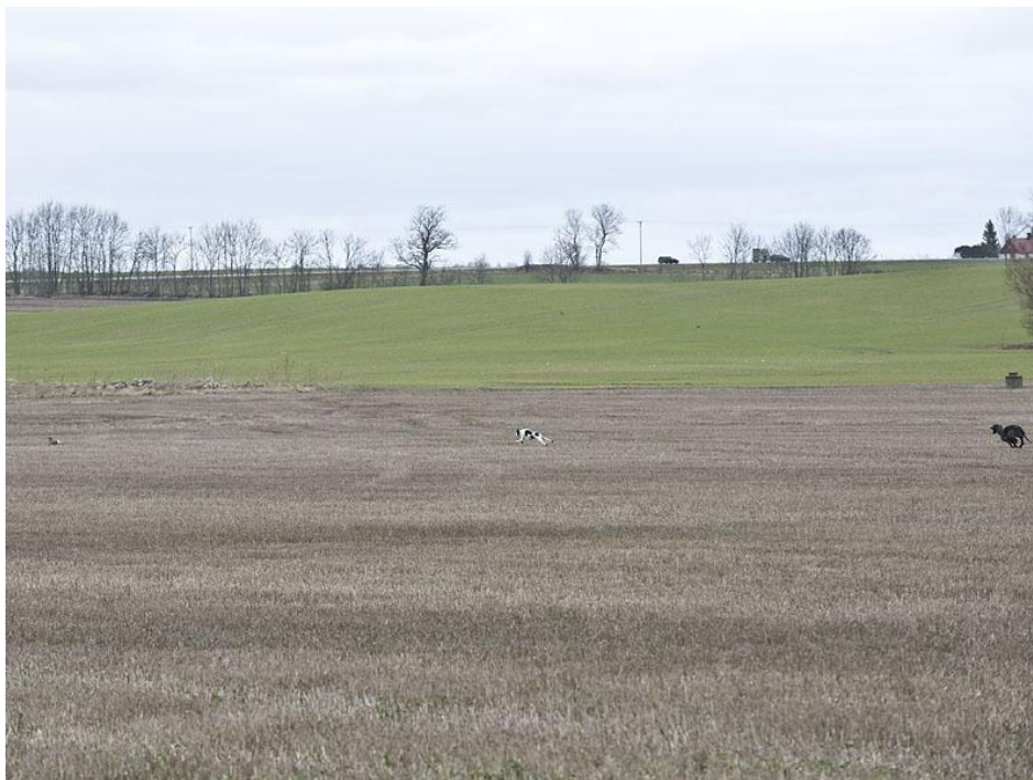
Två hundar och en hare – nu krävs ett fungerande "NEJ"

Lägg ett gäng korvbitar på köksgolvet, släpp ut valpen. Låt den äta några bitar och säg "NEJ". Slutar den äta? Ryggar den tillbaka och ängsligt viker ner svansen – stort grattis! Då är det bara att öka avståndet, och därmed svårigheten. Men om valpen fortsätter glufsa korv, så kliv snabbt fram och ge den en snabb åthutning tillsammans med ett skarpt "NEJ". Observera hur valpen agerar efter din korrigerande, visar den underkastelse? Bra, lös upp den igen och låt den be om förlåtelse. Prova korvtestet igen en stund senare, men inte på samma ställe med samma sak, de fyrbenta är fantastiskt duktiga på att lära sig situationen. Valpen ska lära sig "NEJ", men inte bli osäker på att äta korv.