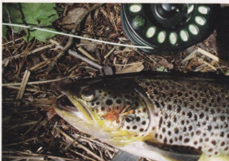
En liten vacker, stationär öring är en inte ovanlig bonusfångst i dessa delar av Mörrumsån.

Det är inte varje dag det öppnas en ny laxfiskesträcka i Mörrumsån – men i slutet av mars har du chansen att svinga spöt över jungfruliga vatten, nedströms Fridafors.