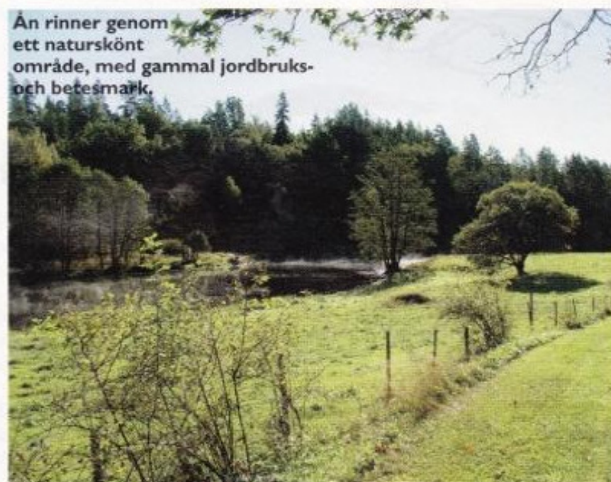
Ån rinner genom ett naturskönt område, med gammal jordbruks- och betesmark.