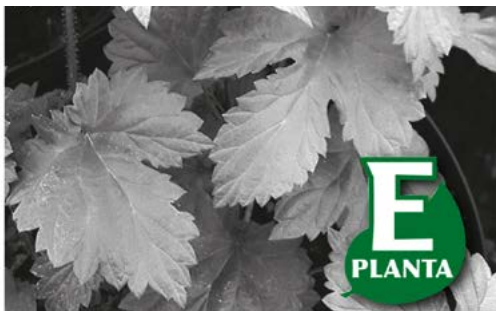
Bild: Läs mer om Österåkers egna växter på sida 3.