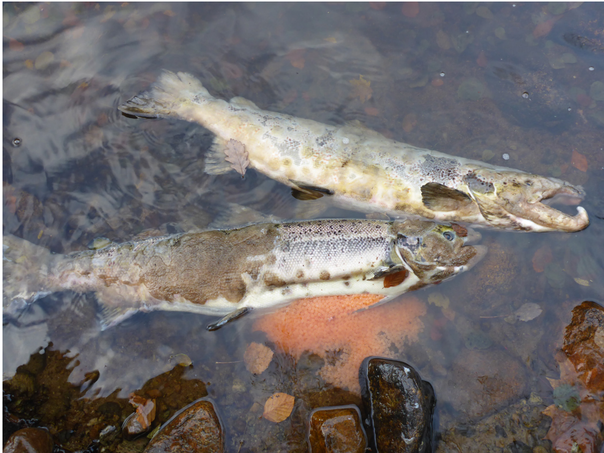
En hanlax (överst) och en honlax funna på hösten i strandkanten på en svensk älv, båda döda sedan en kort tid och uppenbart angripna av bakterier och svamp. Högst sannolikt har de dött som resultat av brist på vitaminet tiamin, även angreppen av bakterier och svamp är då orsakat av tiaminbristen som slagit ut immunförsvaret hos dessa fiskar.

för hälsan. Ämnet kunde isoleras och kallades tiamin, eftersom det innehöll svavel (theion på grekiska). Ett annat tidigt namn var aneurin, då man även observerade att ämnet var mycket viktigt för olika neurologiska funktioner. Så småningom blev det också benämnt vitamin B1, då man insåg att det var ett av de först upptäckta vattenlösliga vitaminerna som människor och djur behöver få i sig via födan. Trots den nya kunskapen fortsatte man att konsumera polerat ris på vissa platser i Asien fram till i mitten på 1900-talet, vilket från och till orsakade tiaminbrist hos människor. Bristsjukdomen kallades i detta sammanhang för beriberi.