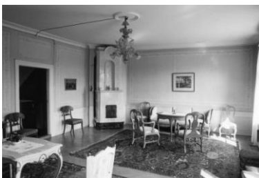
Stora salongen - Bröllopsrummet

Mangårdsbyggnaden uppfördes under 1790-talet av dåvarande ägaren Ryttmästare Carl Magnus Kruse av Verchou. Den är uppförd i timmer i två våningar med vind. Husets fasader är klädda med bred stående spontad panel målad i brutet vitt, entrén har en klassicistisk portal och en dubbeldörr målad i engelskt rött. Fönsterbågarna är likaledes engelskt röda och fönsterfodren är gula. Mansardtaket med valmade gavelspetsar täcks av tegel. Samtliga fönster byttes på 1980-talet, och huset målades i de nuvarande färgerna år 2005.