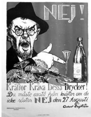
Valaffischer från folkomröstningen 1922