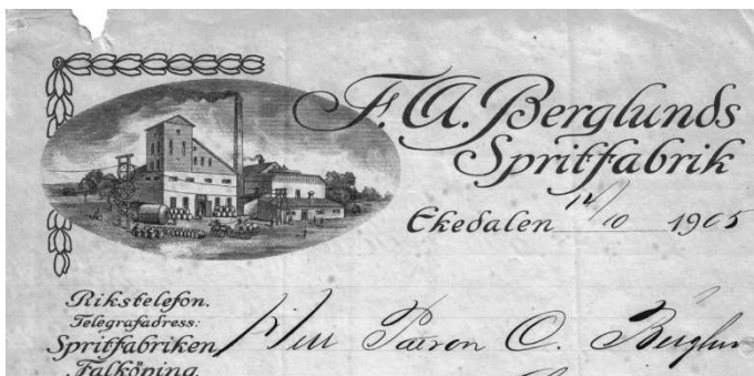
En faktura från FA Berglunds Spritfabrik i Ekedalen, 1905