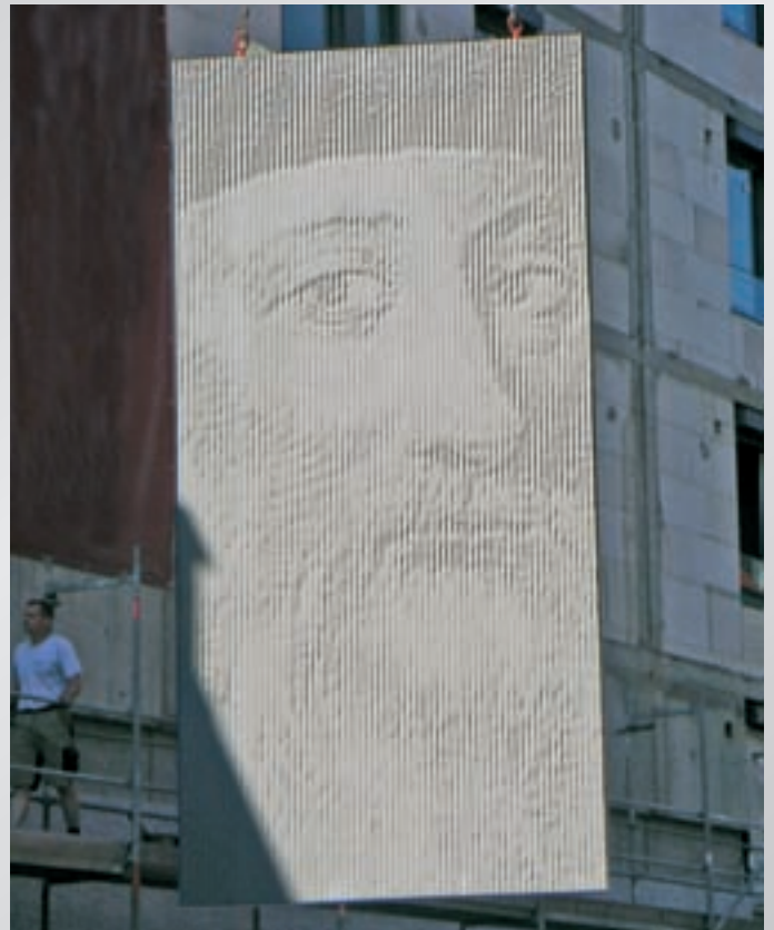
Betonelement für die „Gutenberghöfe“, Heidelberg Concrete panel for the „Gutenberghöfe“, Heidelberg Élément béton pour la „Gutenberghöfe“, Heidelberg