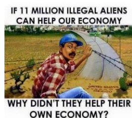
Meme som ifrågasätter hur invandrare från fattiga länder bidrar till ekonomin