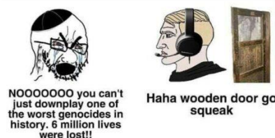
Meme som hänvisar till och visar stöd för konspirationsteorier om att förintelsen överdrevs eller aldrig skedde