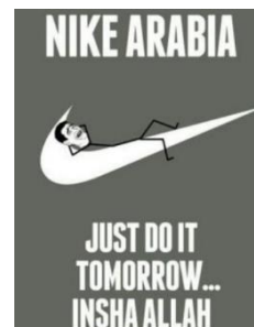
Meme som skämtar om att araber är lata