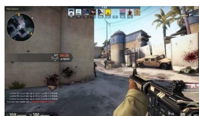
Bild 12, ett in-game chatt-forum, discordloggan och player view av Counterstrike Global