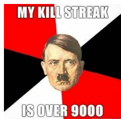
Meme som låtsamt skämtar om förintelsen genom en spel-/animereferens

hot. Online-diskussionerna innehåller också beskrivningar av nödvändiga lösningar som måste vidtas för att lösa problemen. Push-faktorerna bidrar därmed till att unga söker sig till extrema grupper online och gör dem mottagliga för extrema åsikter, online-propaganda och rekrytering. Det hårda debattklimatet online kan också verka som en push-faktor då föreställningar om att normalsamhället är emot en och upplevelser av kränkningar och orättfärdigheter kan förstärkas när man möts av påhopp eller kraftiga avståndstaganden i många forum. Det kan skapa en starkare gemenskap med gruppen som erbjuder stöd och validerar de egna åsikterna. Pull-faktorer som att finna gemenskap, stöd och erkännande i en extrem grupp finns också i en onlinemiljö. Samtidigt kan personer som ses som förebilder och relateras till att locka till en mer extrem miljö.