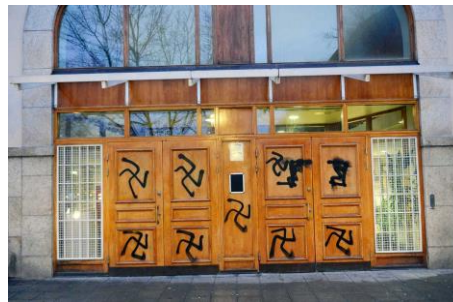
Bild 10, Hakkors klottrade på en moské i Stockholm 2014