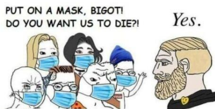
Meme om att använda munskydd och följa coronarestriktioner, som humoristiskt förstärker en vi-och-dom-känsla mellan de som litar på myndigheterna och de som inte gör det