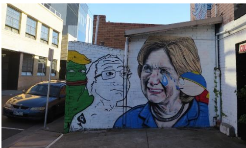
Bild 9, Graffiti av Hillary Clinton tillsammans med bl.a. en Trump-version av memen Pepe the Frog.

Upplevelsen att många delar ens åsikter, även om alla inte tolkar symbolerna på samma sätt, bidrar till en känsla av gemenskap . Det kan innebära att en ensam person i Filipstad upplever sig vara en del av ett stort nätverk och har stöd från andra runt om i världen. Detta innebär att så kallade ensamagerande terrorister sällan upplever sig ensamma utan ser sig själva som en del av något större utan att varit anknutna till en organisation. Samtidigt så påverkar det de radikalnationalistiska rörelserna som finns i Sverige, som NMR, och inspirerar och gör att de också upplever ett större stöd än de har rent medlemsmässigt. Det gör dem även mer attraktiva för yngre.