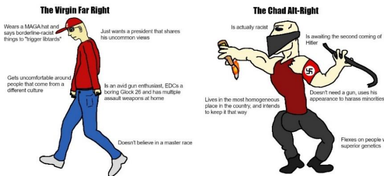
Bild 8, En meme i formatet Virgin vs Chad, där betydelsen och eventuell ironi kan vara oklar. Far right och alt-right är olika benämningar på extremhögern. Virgin representerar en avmaskuliniserad man som inte lyckas imponera på kvinnor (eller andra män) medan Chad är en populär, attraktiv och hypermaskulin figur som varierande kan representera ett ideal eller ironiskt skämt

Radikalnationalister online är inte en enhetlig aktör utan är mer som ett komplext nätverk med olika noder och samlingsforum. Flera aktörer skapar tillsammans en gemensam världsbild och en social gemenskap, samarbetar med och inspirerar varandra. Digitala miljöer, både sociala medier och egna webbplatser, möjliggör en ostrukturerad men samtidigt stor spridning av liknande åsikter. Interaktivitet mellan individer och snabb återkoppling rörande budskap effektiviserar propogandan från de aktörer som aktivt vill sprida ett budskap, som NMR. Detta tenderar att göra propogandan mer övertygande, förstärka och normalisera mer extrema åsikter vilket i förlängningen kan leda till radikaliserings av individer.