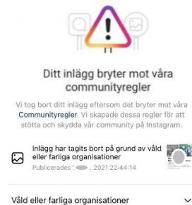
Bild 13, från Instagram där en användare visar att sitt inlägg har blivit nedtaget. Bilden följs av en text där användaren klagade på censur

Nedstängningarna leder också till klagomål och konspirationer om att vissa åsikter censureras vilket kan ge bränsle till organisationer som är frånvända det övriga samhället och göra att individer som lockas av de tankarna söker sig till mera extrema forum där de kan prata öppet. En strategi flera extrema organisationer använder sig av är att anpassa sig till reglerna i vanliga forum som Youtube och Instagram men länka vidare till forum som Telegram och Gab där extremistiskt material inte modereras. I dessa forum normaliseras extrema ståndpunkter samtidigt som kritiker marginaliseras. Det innebär att medlemmarna matas med en ensidig extrem propaganda som kan leda till radikalisering.