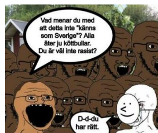
Bild 7, Meme från nordfront, använder sig av figurer som kallas wojacks

Mer och mer extrema undertoner normaliseras när vanliga resonemang dras till sin spets. En sådan process kan ha startpunkten i att ljus hy och blå ögon är recessiva drag och utvecklas till att invandring och "rasblandning" kommer leda till att den vita "rasen" utrotas. För vissa rättfärdigas därmed resonemanget om dödandet av människor med annan hudfärg som självförsvaret, som i teorier om the Great Replacement eller White genocide . Även väldigt extrema ståndpunkter som dessa kan spridas via memes utanför den mindre kretsen som skapade bilderna och stod för idéerna. Detta sker särskilt då vissa marginella internetgemenskaper strategiskt jobbar med att skapa och sprida material till mer konventionella plattformar för att få ut sitt budskap. Memes används för att sprida politiska budskap och ideologisk propaganda på ett sätt som är lättillgängligt för den vanliga internetanvändaren, och gör att byggstenarna för att övertygas av en extrem ideologi kan finnas redan innan individen har läst en enda politisk text eller manifest.