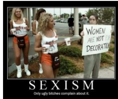
Bild 6, Meme från MGTOW, ett antifeministiskt forum för män

Ironi är vanligt förekommande och det är ofta svårt för både utomstående och initierade att avgöra om de underliggande budskapen är på skämt eller allvar. Humor kan också användas som en ursäkt och skyddar den som publicerar memes med extremare undertoner. Mer extremt och kontroversiellt material får ofta större spridning, eftersom de väcker mer reaktioner hos läsarna, vilket leder till att fler interagerar med inläggen och kommenterar, delar eller gillar.