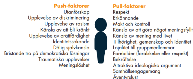
Bild 15, Push- och pull-faktorer från Socialstyrelsens utbildningsmaterial om våldsbejakande extremism

Memes och internetkulturen i allmänhet kan bidra till både push- och pull-faktorer, som pressar en person ur ett sammanhang respektive som drar in en person i en ny miljö (gå att läsa mer om här ). Push-faktorer, som en känsla av utanförskap och frustrationer med samhället kan underblåsas av online-propaganda vilket kan bli kraftfullt då många unga är identitetssökande och söker sammanhang online. Sammanhängande beskrivningar av stora samhällsproblem presenteras i diskussionsforum som förklaringar till de problem som individerna upplever i sina egna liv. Berättelser erbjuder också förklaringar om vilka som är ansvariga för problemen, där andra grupper fungerar som syndabockar eller presenteras som