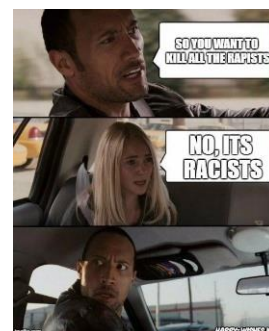
Meme där skämtet bygger på en föreställning om att mörkhyade män är våldtäktsmän