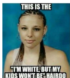
Meme med ett underliggande budskap om rasblandning