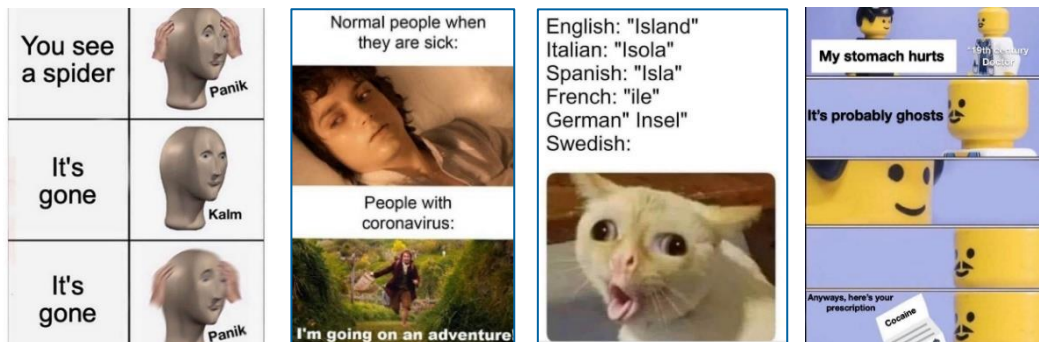
Bild 3, fyra memes, eller humorbilder, utan extremistiska undertoner, där humorn bygger på att läsaren kan relatera till skämtet

Memes är vanligt förekommande internetfenomen som oftast har målet att roa, i essensen humorbilder. Samtidigt kan de användas för att ge uttryck för odemokratiska åsikter på ett mer lekfullt och kontextberoende sätt, samtidigt som de bidrar till en åsiktsförskjutning i vad som anses normalt och acceptabelt. Detta kan vara svårt för utomstående men även för rättsväsende att bemöta. Det är viktigt att komma ihåg att memes inte alltid innehåller budskap utan är en del av den allmänna internetkulturen, men att det ofta är svårt att avgöra exakt vad som är extremistisk propaganda och inte.