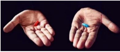
Bild 5, En kombination av en redpill och Pepe the frog-meme. Normies är en negativ benämning på normala människor utanför den egna kretsen.