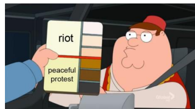
Bild 1, En meme som hänvisar till Black Lives Matter-protesterna och stormningen av Capitolium i USA (2020–2021) med ett motbudskap om "omvänd rasism" och att svarta utsätts för en positiv särbehandling.