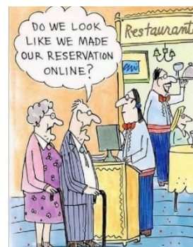
Bild 4, Framsida av ett födelsedagskort skapat av Harley Schwadron

Fenomenet memes är egentligen inget nytt utan bara moderna varianter av humor- och satirbilder som funnits länge i andra format, som exempelvis seriestrips i tidningar. Skilnaden är dock att vem som helst enkelt kan skapa memes som når ut till stora mängder människor utan att det genomgår någon form av granskning. Ungdomar idag exponeras också generellt för fler budskap på internet en vanlig dag än tidigare generationer gjort via tidningar.