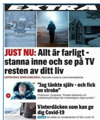
Meme som driver med medias teckning av coronapandemin