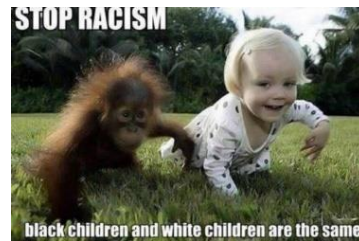
En uttryckligen rasistisk meme som framställer mörkhyade som apor