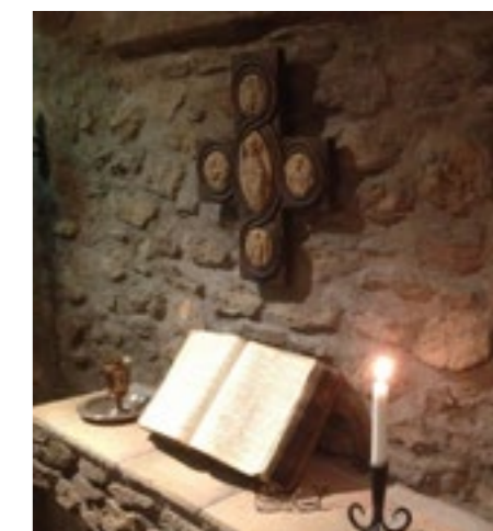
I kapellet, med plats för 15 personer, erbjuds alltid frivillig morgon- och aftonbön.