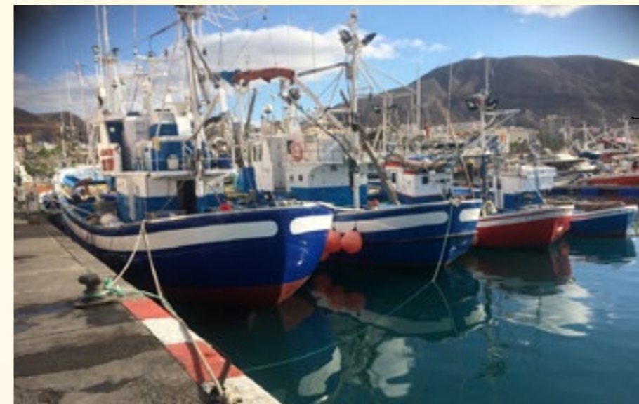
Los Cristianos, nära skolan finns hamnen med fisket – och båttrafiken till de övriga Kanarieöarna.