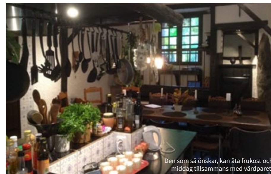
Den som så önskar, kan äta frukost och middag tillsammans med värdparet.

Ovanför vackra stenhus, färgglada båtar i Medelhavet, yppig grönska och blomsterprakt sträcker sig ändlösa vinodlingar över Pyreneernas mjuka kullar – Frankrikes trädgård.