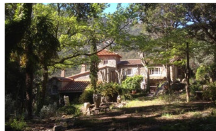
Det sägs att huset härstammar från 900-talet och var en del av ett kloster. Under de århundraden som följde gjordes tillbyggnader och förändringar allt eftersom behoven förändrades. Det mesta idag är byggt på 1600-talet.

”Att flytta till ett annat land, dessutom till landsbygden, kräver stor beslutsamhet, motivation och mycket tålamod”