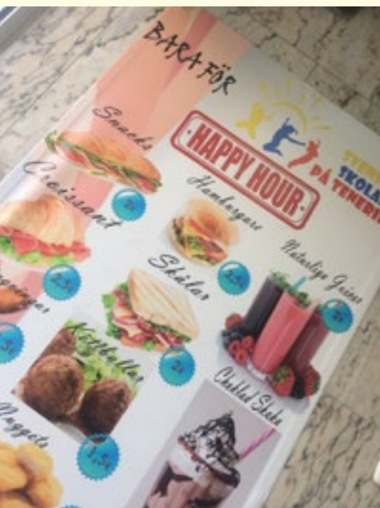
Bamban – inte riktigt som i Sverige.