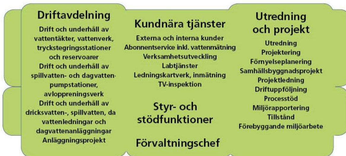
Figur 1. Organisationsschema för Laholmsbuktens VA.

Nämnden för Laholmsbuktens VA ansvarar för drift av vatten-, spillvatten- och dagvattenverksamheten i Halmstads och Laholms kommuner. Den gemensamma nämnden ingår i Halmstads kommuns organisation. Sedan 2014-07-01 är Laholmsbuktens VA en egen förvaltning som är indelad i tre avdelningar, se figur 1.