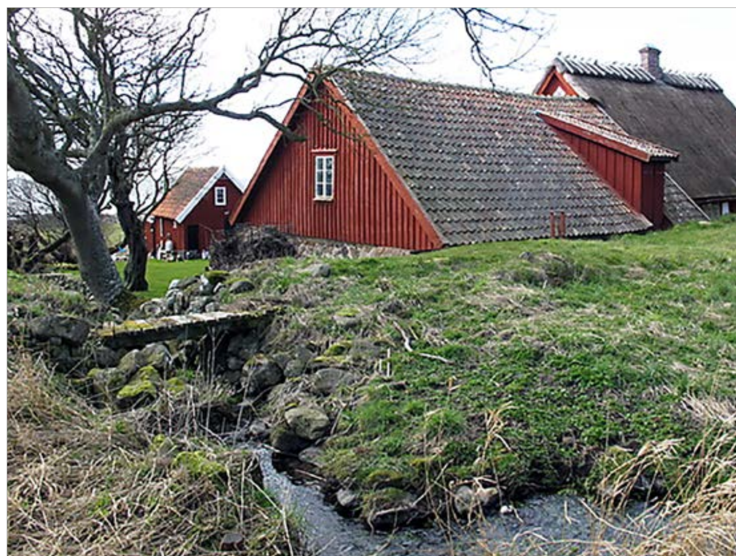
Vattenmøllebäcken fylld på kvarndammen.