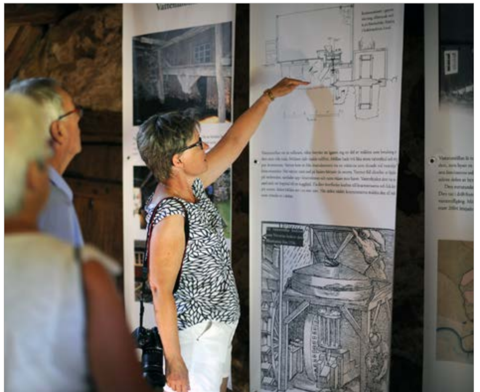
Långa vepor tar upp en stor del av norrväggen i möllan. Den första visar bilder på utgångsläget 2004 och glimtar från olika faser i restaureringsarbetet. Den andra förklarar hur malningen gick till. På den tredje vepan dominerar lantmäteriets karta från 1822 och ett tidigt fotografi av gården och byggnaderna. Ytterligare en vepa handlar om möllarna som skötte kvarnen och bodde vägg i vägg med den.