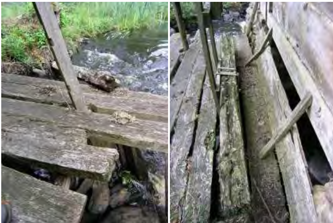
Den tidigare gångbrygga, vilken var på väg att ge sig.