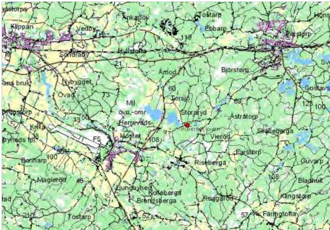
Ruveröds kvarn ligger öster om Östra Sorrödssjön, ett par kilometer från riksväg 108 mellan Ljunghed och Perstorp.