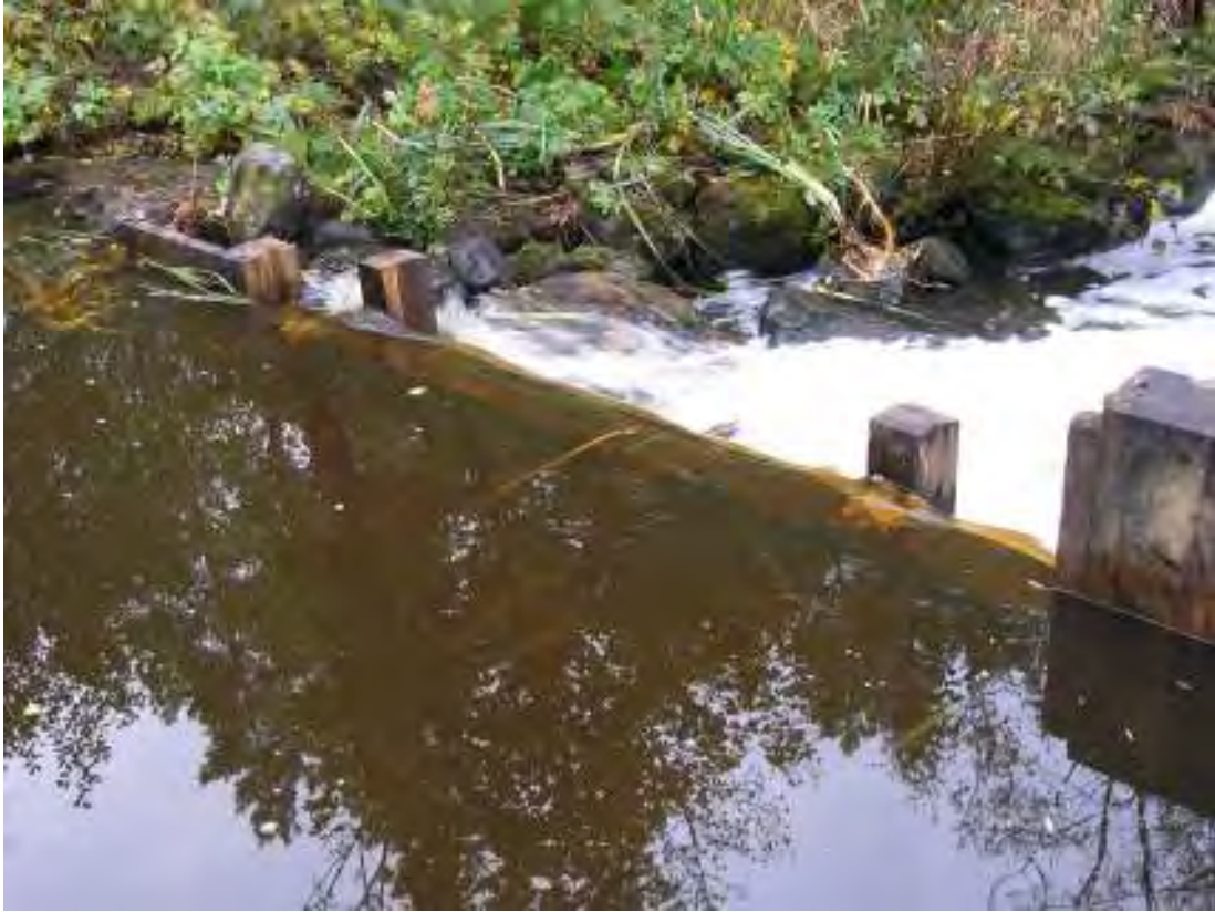
Ruveröds kvarns rekonstruerade dämme. I mitten av dämmet finns möjlighet att placera en bräda för att vid malning kunna dämna mer vatten och på så vis temporärt öka kvarnens kapacitet.

Kommande insatser bör omfatta vattenhjulet liksom skador i kvarnhusets stensockel och anslutande skiftesverk. Även boningshusets östra gavel liksom syll och nedre del av panel uppvisar behov av snara åtgärder.