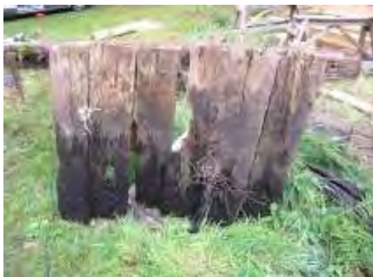
Detalj av tidigare palissad.