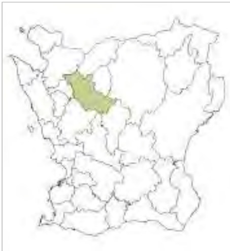
Ruveröds kvarn ligger i Klippans kommun