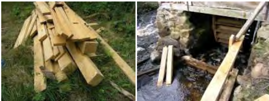
Upplag av lokalt avverkad ek i väntan på användning. Arbete med rekonstruktion av palissad och kvarnlucka.

Det finns möjlighet att rekonstruera palissaden i sin helhet. Entreprenören har därför lämnat kvar delar av den understa, horisontella brädan. Det ersättande ekvirket, har fällts i närheten och skänkts till hembygdsföreningen från en av medlemmarna. Överliggaren på palissadens räcke fortsätter en bit utan avslutande stolpe. Den har lämnats så för att underlätta en eventuell förlängning av palissaden, i enlighet med dess ursprungliga dimension.