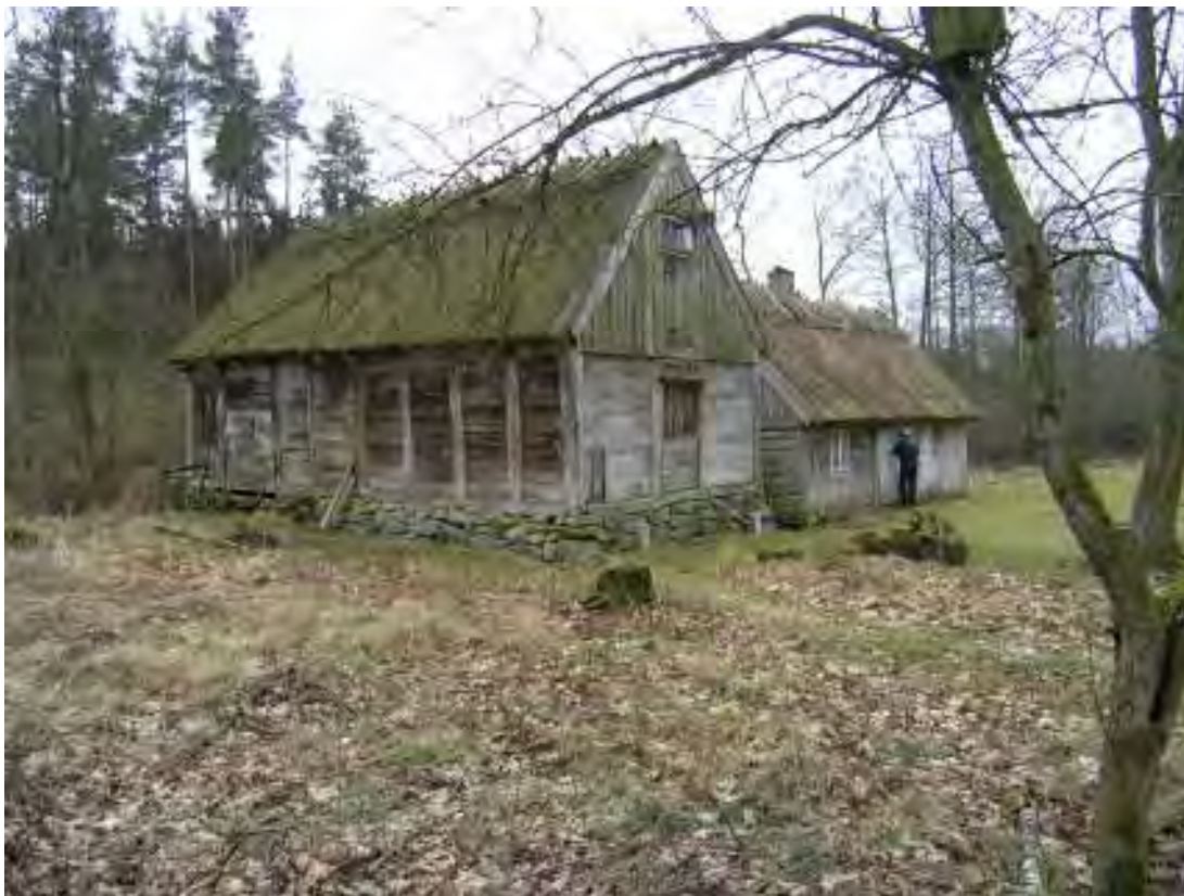
Helhetsbild av Ruveröds kvarn våren 2008.