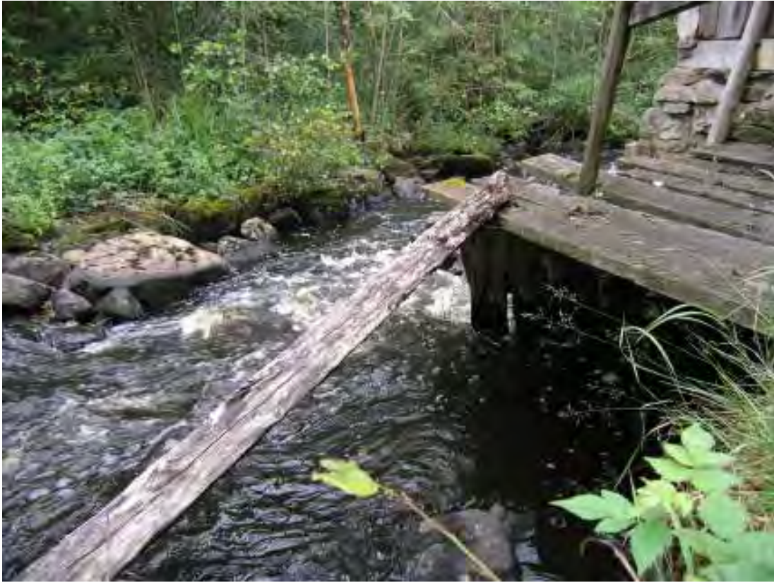
Rester av den tidigare gångbryggan löst liggande, med Ybbarpsån forsande förbi under.