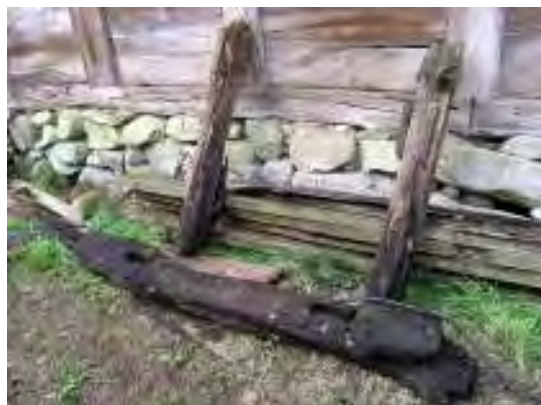
Delar av den äldre kvarnluckan i samband med uppmätning.