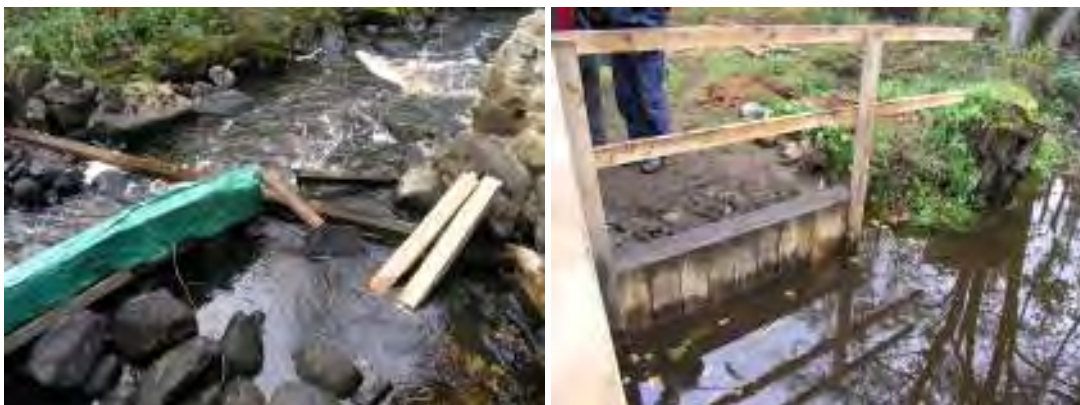
Arbetet med att rekonstruera dämnet har påbörjats.