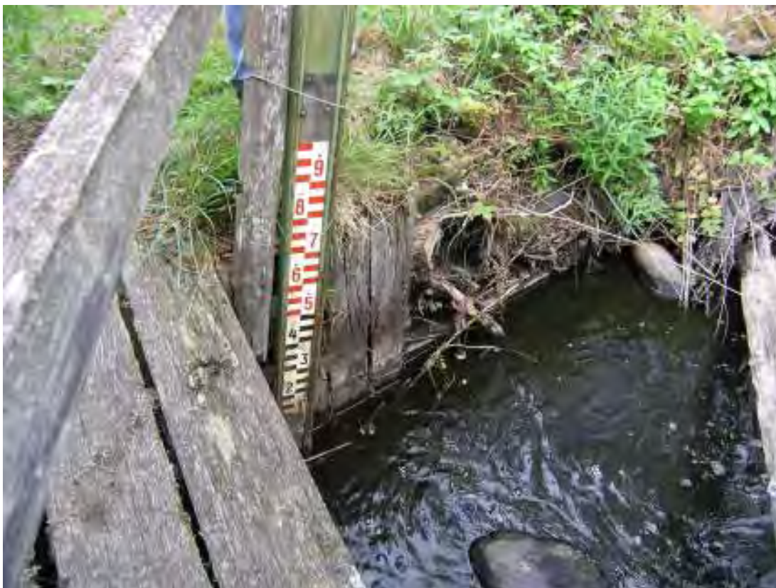
Återstoden av palissaden samt nivåmätare för flödet i Ybbarpsån.