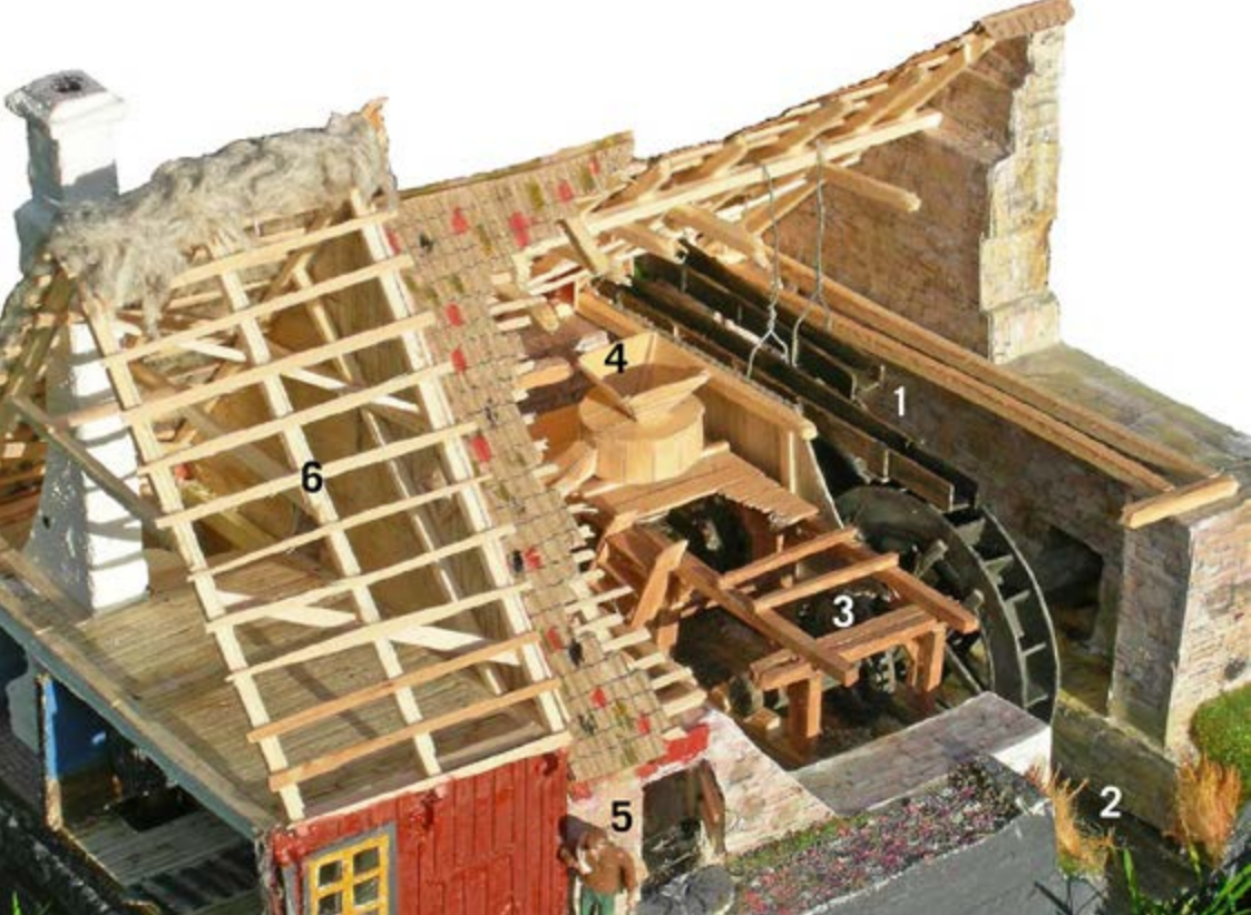
Modell av vattenmöllan som den såg ut vid 1800-talets mitt. Byggt och fotograferat av Henrik Ranby. Skala 1:50.