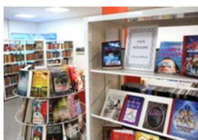
Det nyinvigda biblioteket i Vinninga har blivit en del av Bäcklidens lokaler.