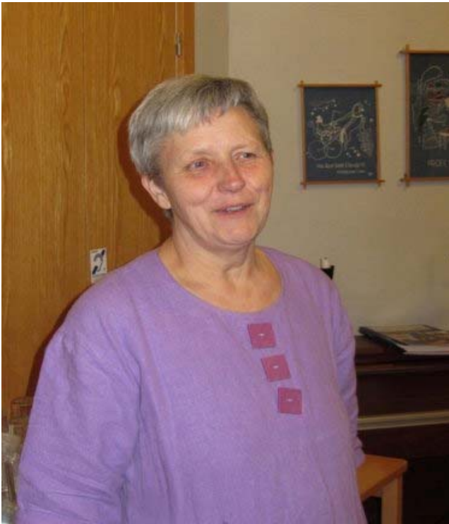
Text och Foto: Caj Abrahamsson