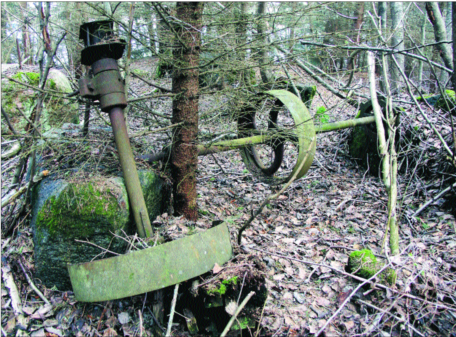
I snårskogen en bit ifrån stranden finns delar kvar av lokomobilen. Remskivor och axlar förtärs långsamt av tidens tand.