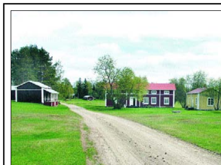
Nygår'n på Hindersön.