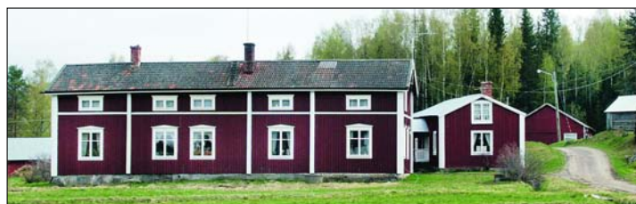
Det var hit, till Ostigårn på Hindersön, den unga hemvårdarinnan från Bensbyn kom.

– Jag blev kvar längre än det var tänkt på grund av förfallstid och