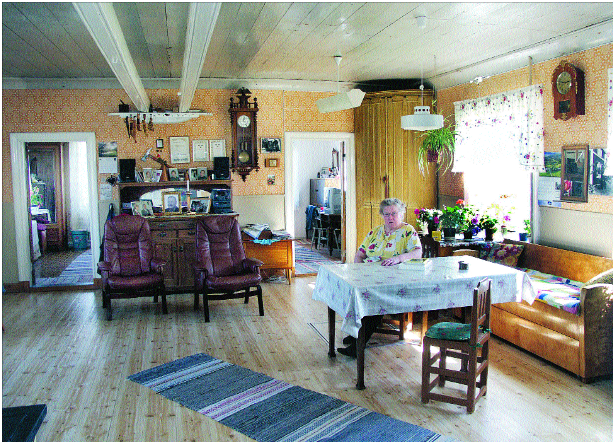
Inga Öhman kom till Ostigårn som 21-åring. Nu är hon på sitt 76:e år och ser tillbaka på en tid med mycket arbete, men också med stor gemenskap och glädje.