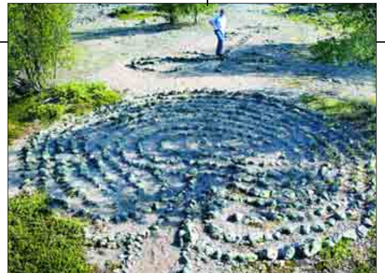
En väl bevarad rundgång finns på Båtöharun, en välkänd fiskeplats, nordost om Hindersön.

Där utanför fiskades det fordom strömming under några sommarmånader. På Kluntarna, Uddskär och Båtöharun, fiskelägen inte långt från Hindersön finns det väl bevarade labyrinter.