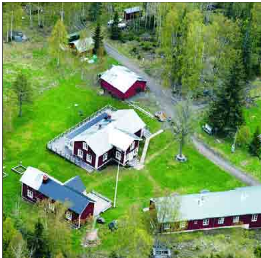
Jopikgården är en modern turist- och konferensanläggning nära havsbandet i Luleå skärgård.

Det förstärker minsann lusten och glansen i skärgårdens kronjuvel.