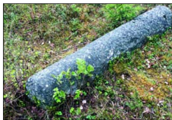
Vid den plats där sliperiet för marmor låg finns ännu rester av verksamheten kvar.

Verksamheten vid ugnen lades ner och byggnaden förföll. Nu är den dock renoverad och kan vittna om en annan tid.