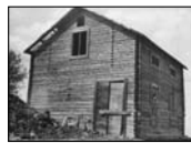
Sliperiet fanns i ett trähus på den gamla gruvkajen vid Hannusviken.

Omkring 1966 undersökte en arbetsgrupp åter fyndigheten, som är 700 meter lång, 50 meter bred och 50 meter djup. Efter provborringar ansåg gruppen att fyndigheten var brytvärd, men att en sådan inte skulle bli lönsam.