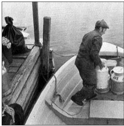
Bönderna fraktade mjölken till Luleå med båt. Så är det än i dag.